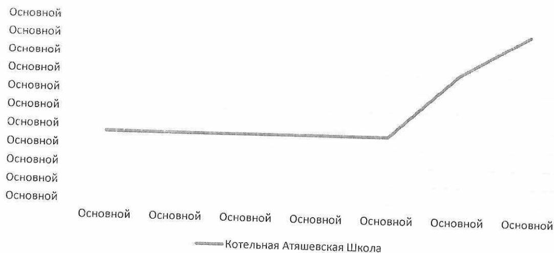
Рисунок 1. Динамика НУР топлива (утв.) на период 2023-2037 гг.

Прогнозы по отпускаемой тепловой энергии и топливопотреблению рассматривались по котельным, которые задействованы в схеме теплоснабжения, со следующим допущением: производство тепловой энергии ведомственной котельной остаётся на уровне базового года. Перспективное значение удельных расходов топлива на производство тепловой энергии приведено на рисунке 1 и в таблице 11.