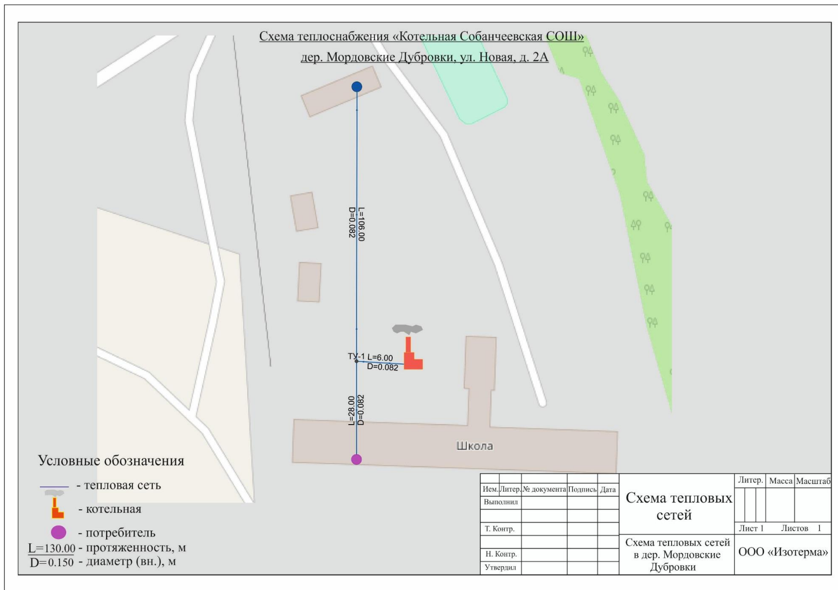
Рисунок 1. Зона действия котельной Собанчевская СОШ