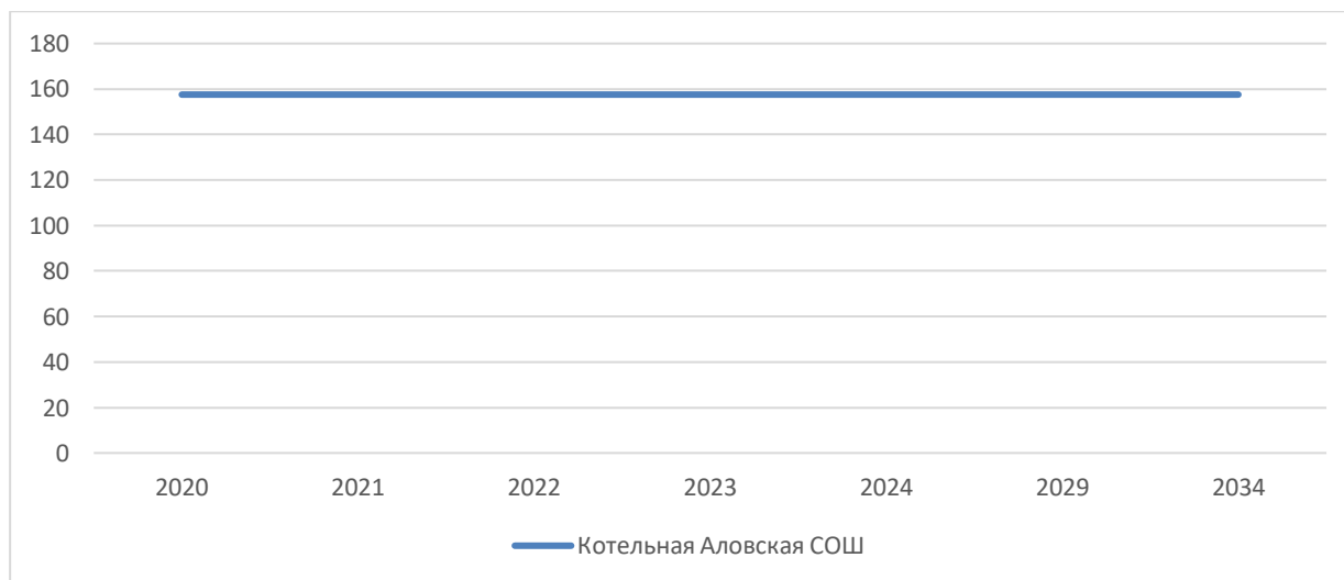
Рисунок 1. Динамика НУР топлива на период 2020-2034 г.г

Прогнозы по отпускаемой тепловой энергии и топливопотреблению рассматривались по котельным, которые задействованы в схеме теплоснабжения, со следующим допущением: производство тепловой энергии ведомственной котельной остаётся на уровне базового года. Перспективное значение удельных расходов топлива на производство тепловой энергии приведено на рисунке 1 и в таблице 11.